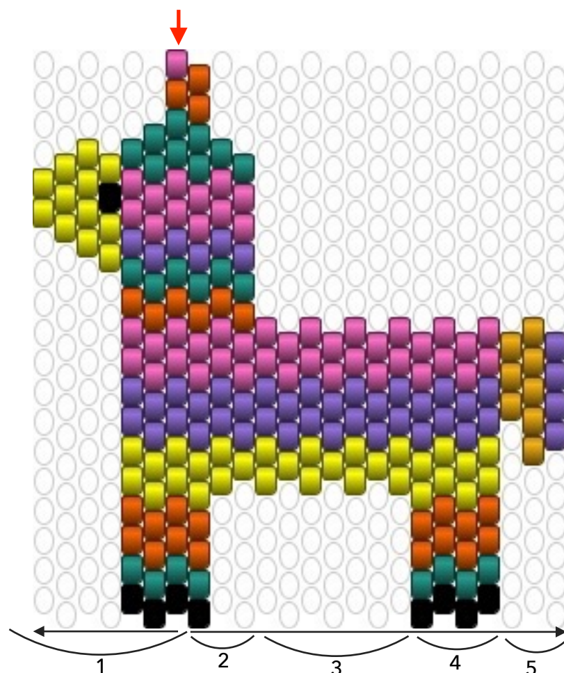
Diagramme de la piñata du tutoriel photo de tissage brick stitch, réalisé en partenariat avec LA PETITE EPICERIE . La flèche rouge désigne le début du tissage, et les numéros les étapes du tutoriel.

Et pour ceux qui veulent s'amuser d'avantage sur ce thème, une calavera et un cactus. Vous pouvez retrouver d'autres diagrammes sur le site www.la-petite-epicerie.fr